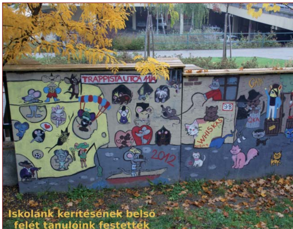
Iskolánk kerítésének belső felét tanulóink festették

A mindennapi munkánk során törekszünk arra, hogy tanulóink, képességeikhez mértén a legjobb teljesítményt nyújtsák. Megyei és országos tanulmányi, kulturális és sportversenyeken értünk el kiváló eredményeket. Több tanítványunk is bekerült és eredményesen szerepelt az OKTV és a KGYTK országos döntőiben. Minden nyolcadik osztályt végzett diákunk továbbtanul közép fokú oktatási intézményben. Gimnáziumunk emelt és középszintű érettségi eredményei átlagosan 80 %-osak. Továbbtanuló diákjaink 90-100 %-át felveszik egyetemi és főiskolai alapképzésekre. Évente 40-50 diákunk tesz közép- és felsőfokú nyelvvizsgát többféle nyelvből.