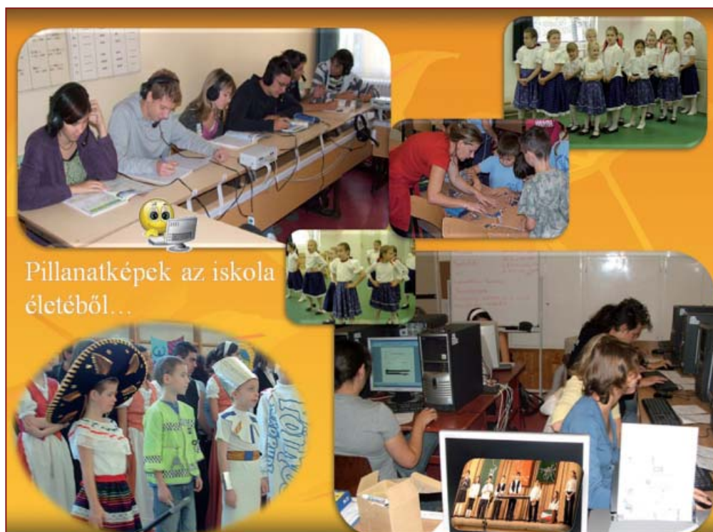
Pillanatképek az iskola életéből...